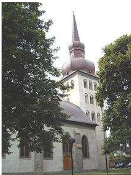
Kath. St. Cyriakus

Der starke massive Turm lässt auf die Zeit um 1300 schließen, da er als fester Speicher für die Kornvorräte gebaut und als Wart- und Wehrturm des Haupthofes Horn mit Schießscharten versehen wurde.